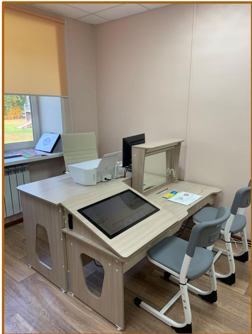
Интерактивный коррекционно- логопедический стол