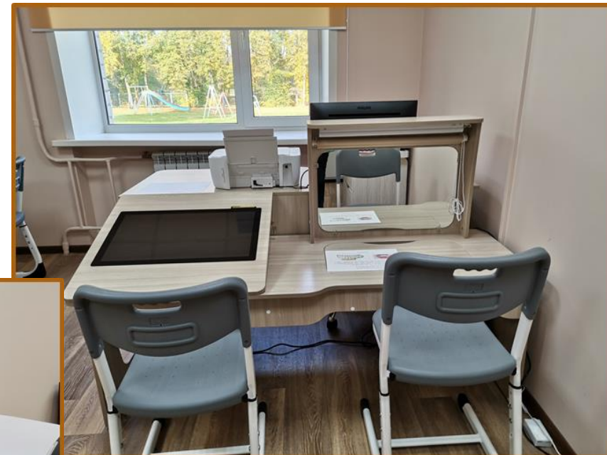
Рабочее место ученика