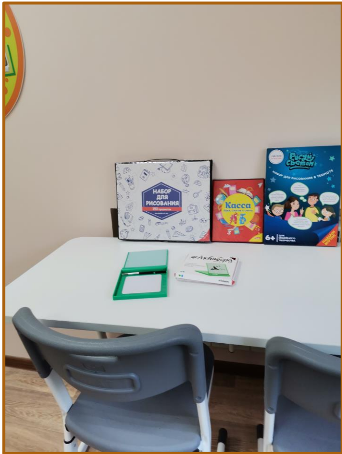
Рабочее место ученика для индивидуальных занятий