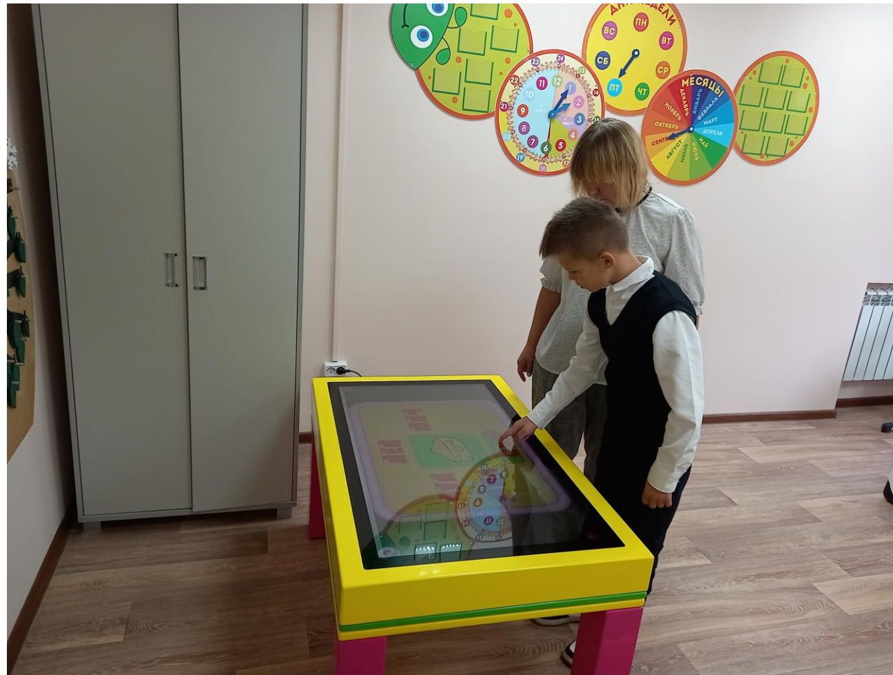
Работа с обучающимися