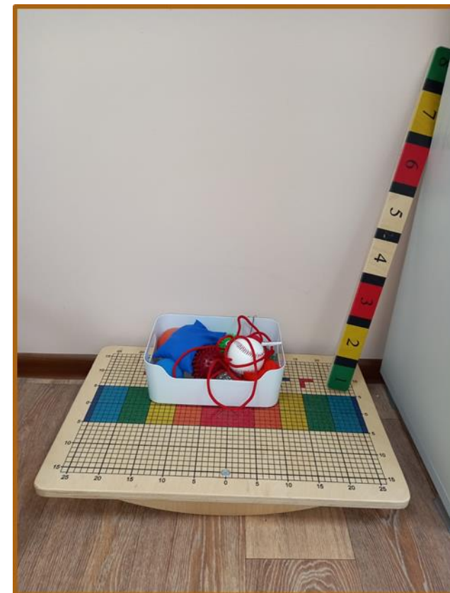
Балансировочная доска «Бильяроу»