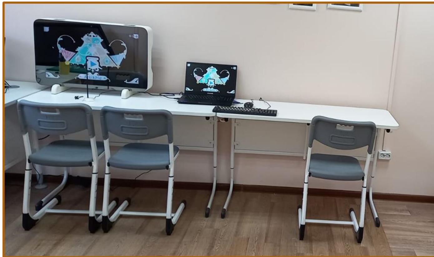
Зона индивидуальных занятий