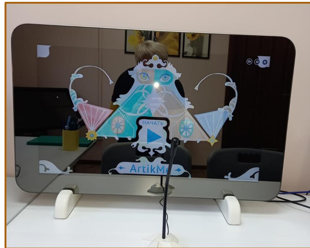
«Умное зеркало ArtikMe»