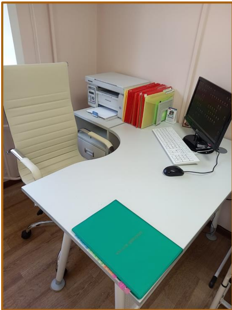
Рабочее место учителя-логопеда