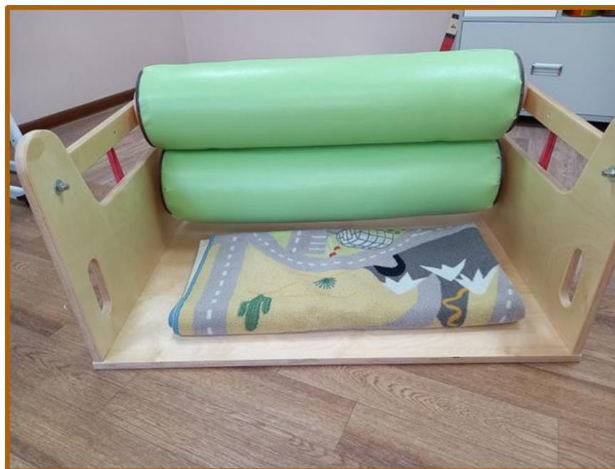
«Машина для обнимания»