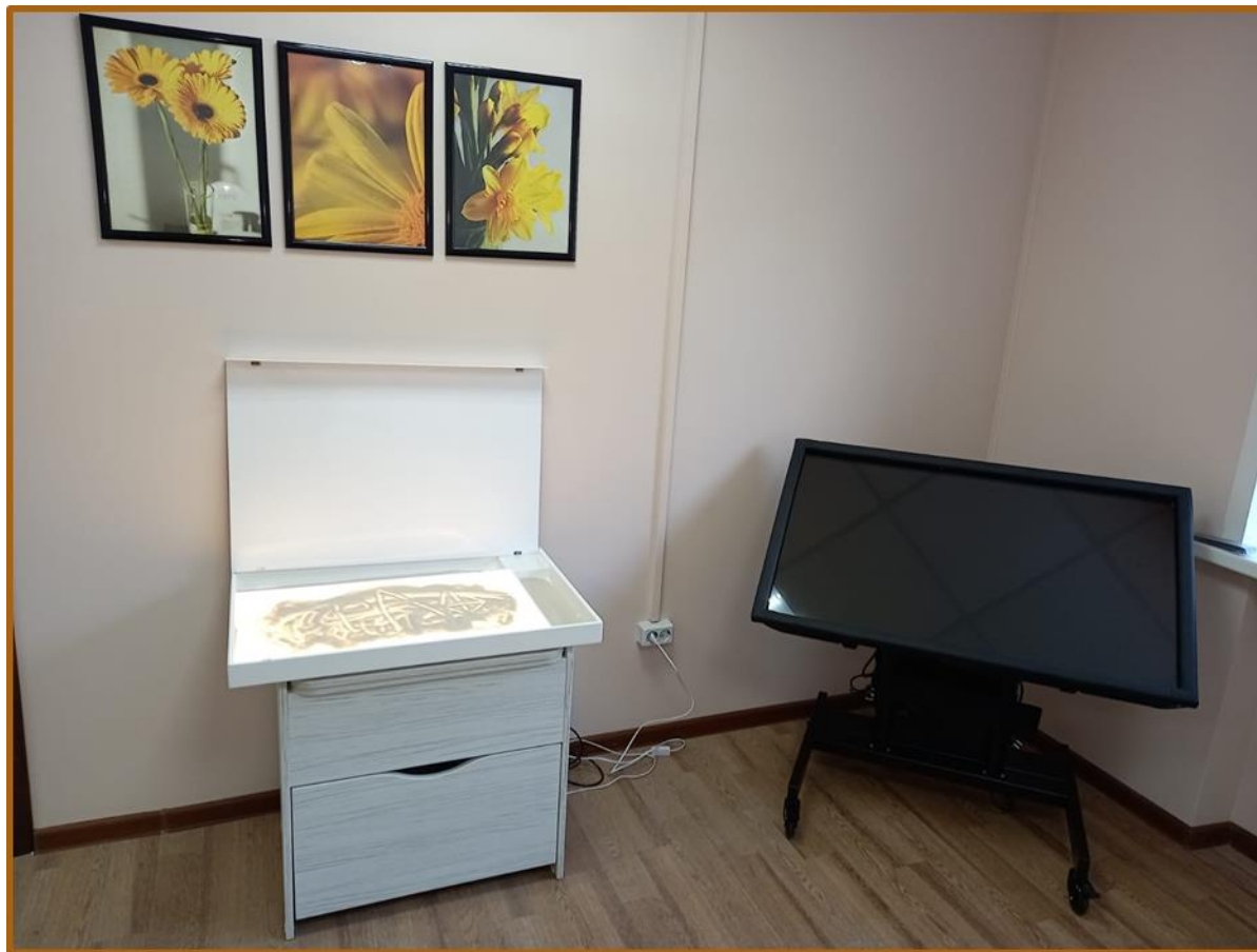
Интерактивный стол «Виэль»