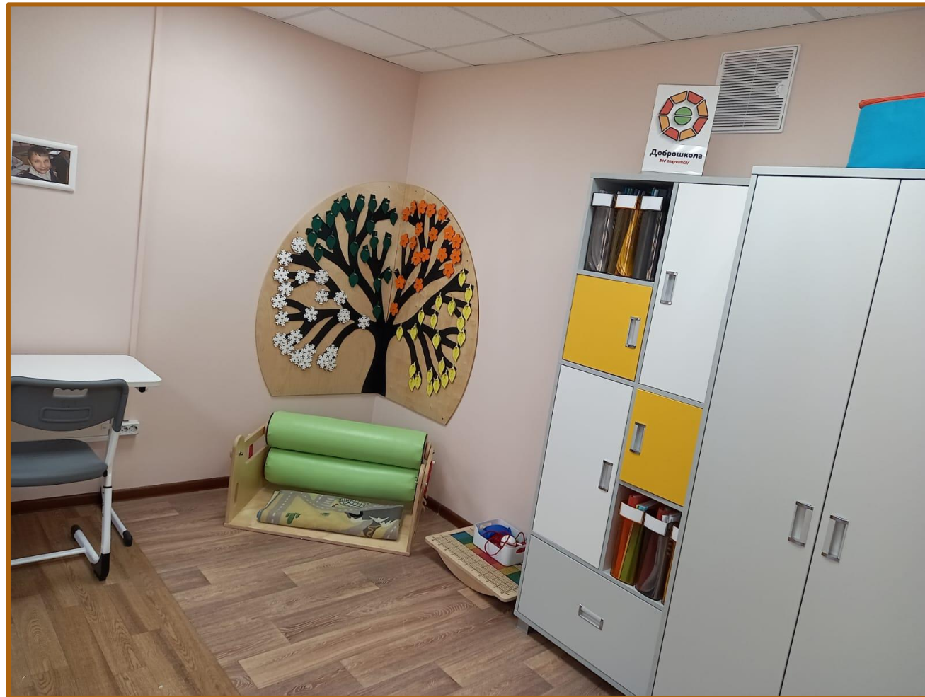
Общий вид кабинета