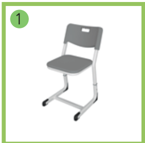
Стул ученический регулируемый.