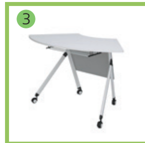
Стол для индивидуальных и групповых занятий.