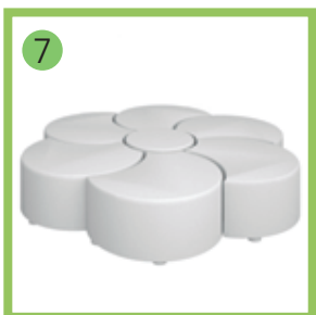
Пуф-трансформер «Цветок 2».