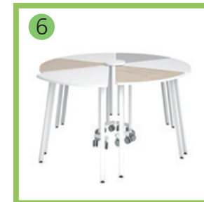
Стол-трансформер «Оригами» ростовой.