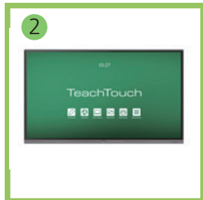
Интерактивная панель TeachTouch 7.0.