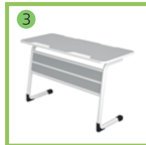
3 Стол ученический.