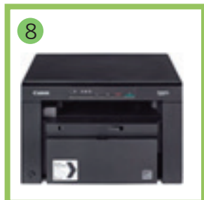
8 МФУ на рабочем столе учителя.