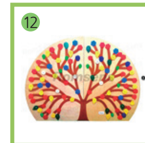
12 Декоративно-развивающая панель "Времена года".