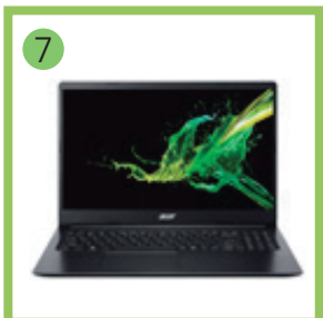
7 Ноутбук для учителя.