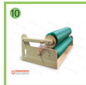
10 Машина для обнимания детей-аутистов.