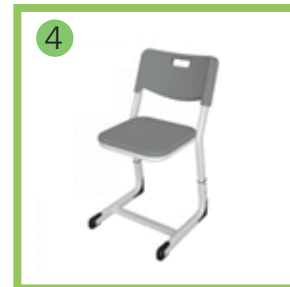
4 Стул ученический регулируемый "LP/1.1.