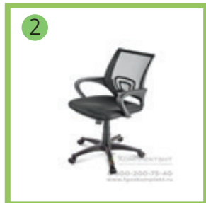
2 Кресло компьютерное (для рабочего места учителя).