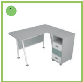
1 Стол эргономичный с приставной тумбой 1.