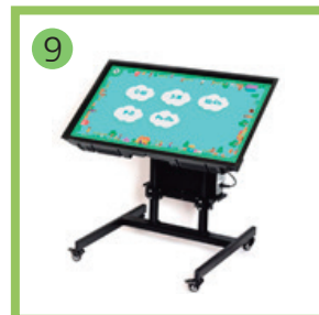
9 Интерактивный стол логопеда ВИЭЛЬ.