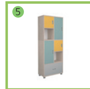
5 Модуль 2X5.1.