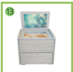
13 Сундучок логопеда «Антошка».