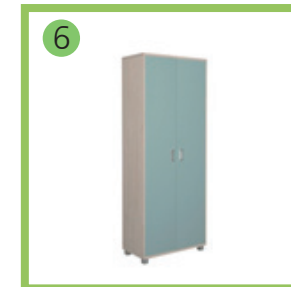
6 Шкаф для одежды.