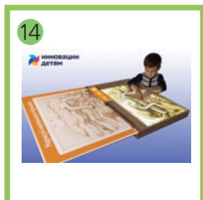
14 Арт-песочница «Sandia».