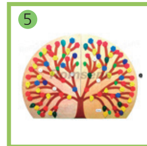
5 Декоративно-развивающая панель "Времена года".