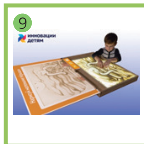
9 Арт-песочница «Sandia».