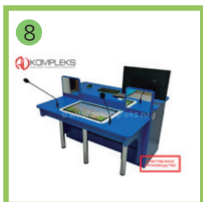
8 Профессиональный интерактивный стол логопеда «Inclusive Logo-Pro Max»