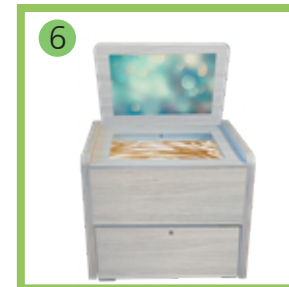
6 Сундучок логопеда «Антошка».