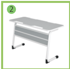
2 Стол ученический.