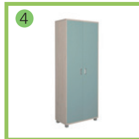
4 Шкаф для одежды.