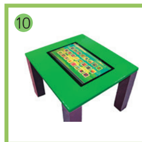
10 Интерактивный стол Уникум-1.