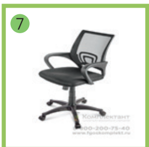
7 Кресло компьютерное.