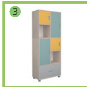
3 МОДУЛЬ 2X5.1.