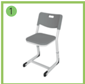
1 Стул ученический регулируемый LP/1.1.